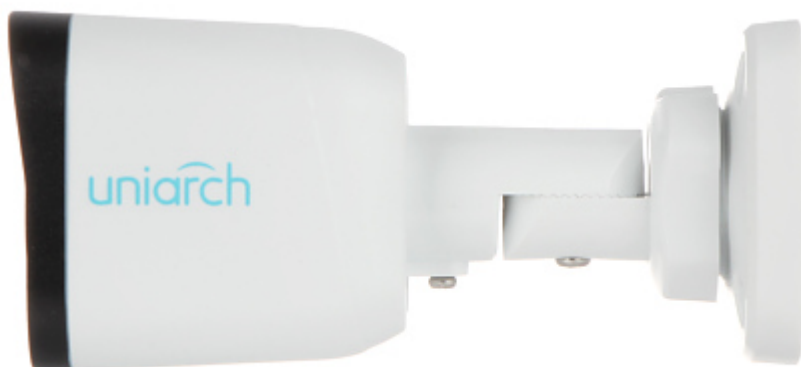
Widok od strony mocowania kamery: