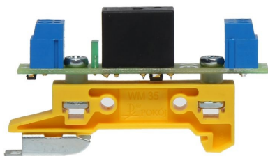
Rys. 1 Montaż na szynie DIN za pomocą podstawki montażowej WM-35 i dystansów 3mm.

Konstrukcja modułu PK1-12-ZX umożliwia montaż na wiele sposobów. Kilka pokazano na poniższych rysunkach.