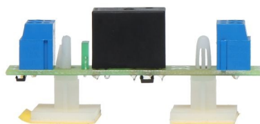
Rys. 2 Montaż za pomocą podstawki montażowej samoprzylepnej